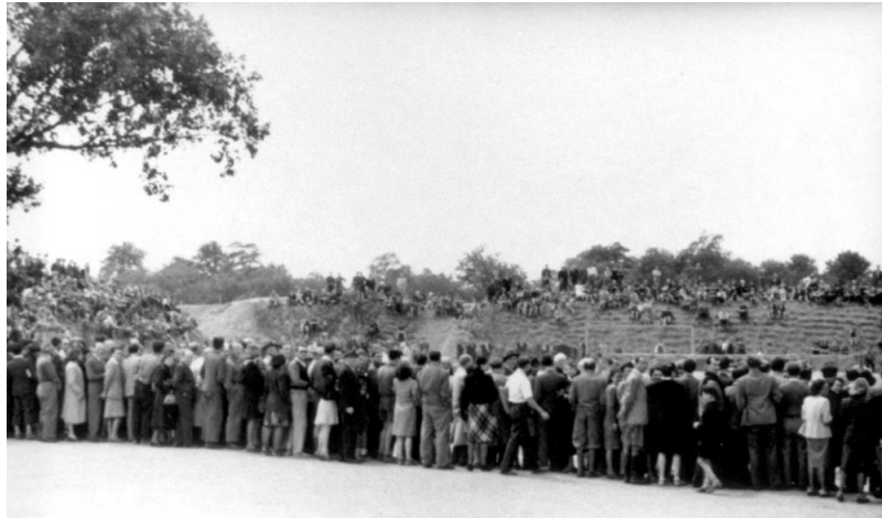
קהל רב צופה במשחק כדורגל בטרזין, 1944.