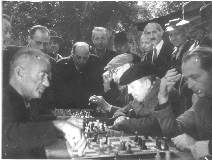
משחק שחמט בטרזין. מתוך סרט התעמולה הגרמני שהוכן על המחנה.