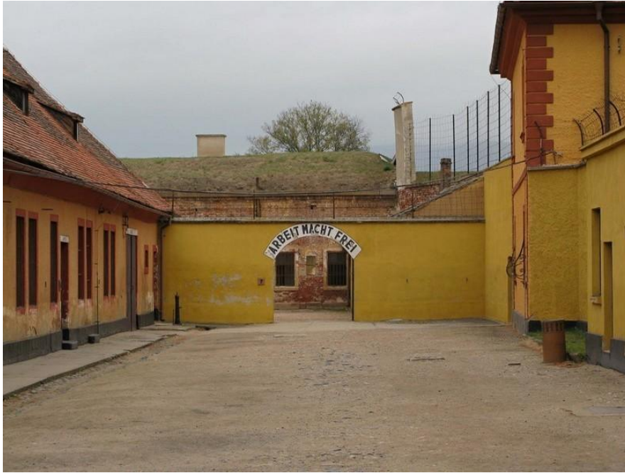
שער מחנה טרזין עם השלט "העבודה משחררת".