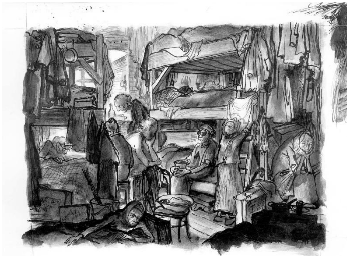
מגורי האסירים בטרזין. איור מאת ליאו האס.

העיירה הפכה לגטו, שנוהל ע"י הגסטאפו, והייתה למחנה ריכוז ליהודי הפרוטקטורט של בוהמיה ומוראביה. מחנה זה, אשר נכפה על תושבי צ'כיה בזמן הכיבוש ע"י הנאצים, היווה נקודה שממנה נשלחו היהודים למחנות ההשמדה. המחנה היה כפוף למשרד "לפתרון בעיית היהודים", בכפיפות למשרד הראשי לביטחון הרייך. את החיים בגטו ניהל היודנראט (מועצת היהודים במחנות לקיום הקשר בין השלטון הנאצי והאסירים).