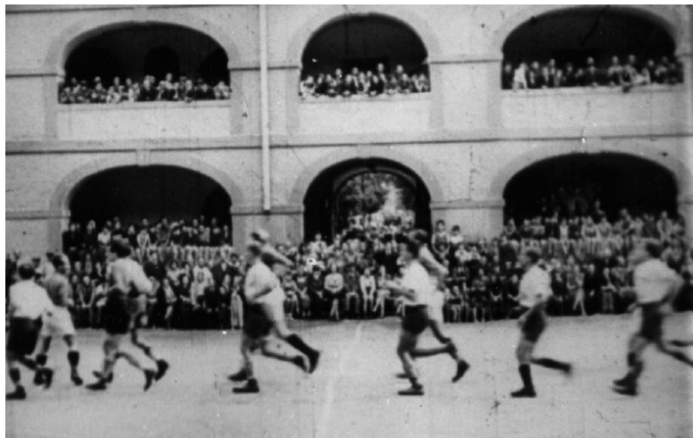
משחק כדורגל בחצר קסרקטין בטרזין. מתוך סרט התעמולה הגרמני שהוכן על המחנה.