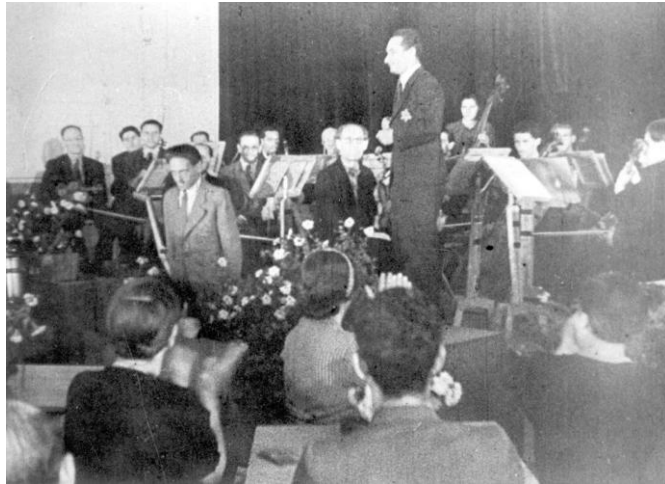
תזמורת מחנה טרזין.

האמנם צפינו בחיים חדשים אידיאליים על רקע השמדת היהודים היומיומית שלא פסקה לרגע, או לחילופין עדים למזימה אפילה וצינית מפרי מוחם הקודח של הנאצים? האם ייתכן, כי בעוד שמדי יום נשלחים יהודים רבים ברכבות להשמדה, מתנהלת ליגה לכדורגל, תחרות שחמט או קברט במרחק קצר במחנה?