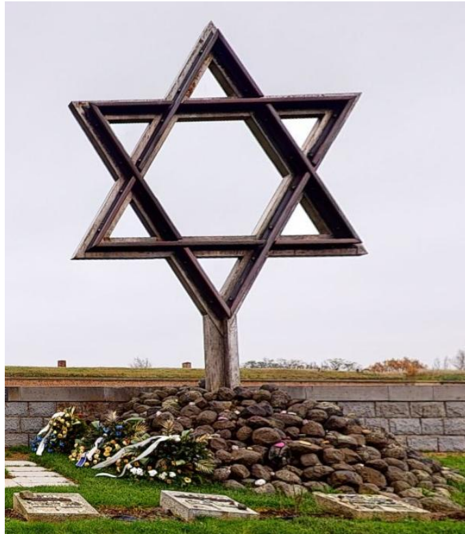
אנדרטה בטרזין לזכר הנספים.